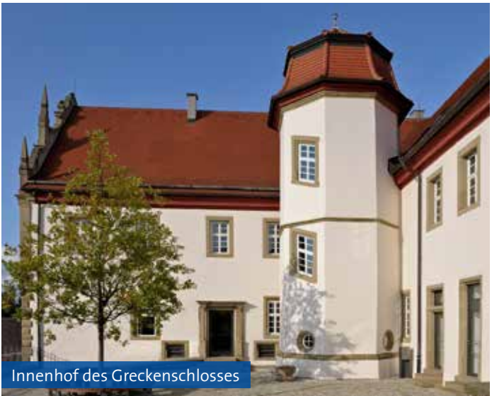
Innenhof des Greckenschlosses