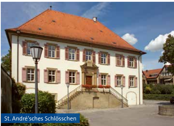
St. André'sches Schlösschen