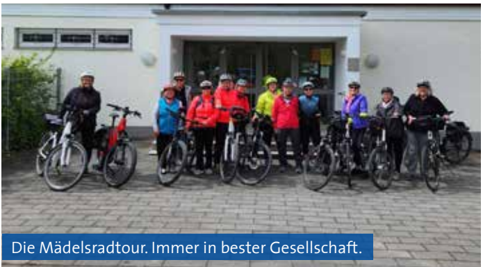
Die Mädelsradtour. Immer in bester Gesellschaft.