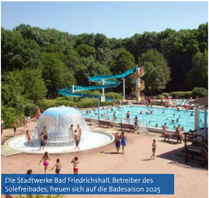
Die Stadtwerke Bad Friedrichshall, Betreiber des Solefreibades, freuen sich auf die Badesaison 2025

Gemütlich kann man im Sole-Sportbecken mit seinen 50-Meter-Bahnen und dem 22 bis 25 Grad warmen, 1,5 bis 2-prozenthaltigen Salzwasser Bahnen ziehen. Um sich ganz zu entspannen, bietet sich der Gang zum Massagebrunnen an, der so manche Schulterverspannung massiert. Für die jungen Badegäste gibt es ein 320 Quadratmeter großes Spaßbecken mit Strömungskanal, Sprudlern und Massagedüsen. Eine weitere Attraktion ist die Riesenrutsche, das Wahrzeichen des Solefreibades. Ein Gefühl von Meeresbrandung vermittelt das alle 30 Minuten aktive Wellenbad, ein besonderer Spaß für Kinder und Jugendliche.