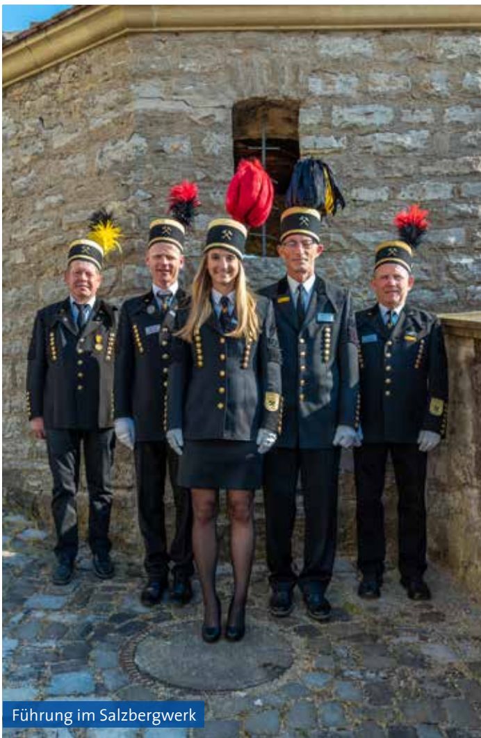
Führung im Salzbergwerk