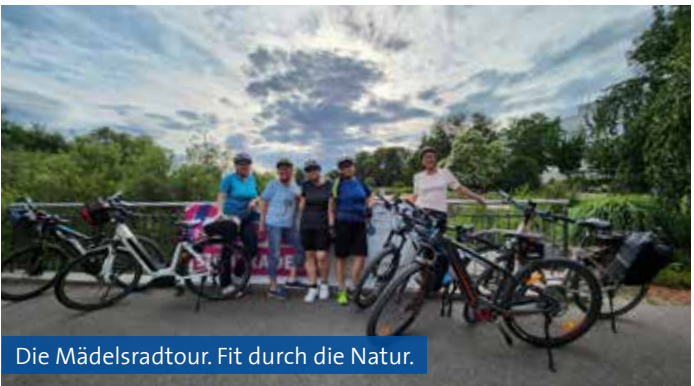
Die Mädelsradtour. Fit durch die Natur.