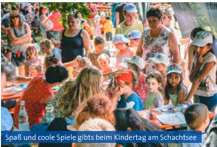
Spaß und coole Spiele gibts beim Kindertag am Schachtsee