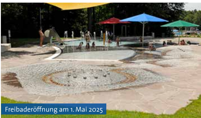
Freibaderöffnung am 1. Mai 2025