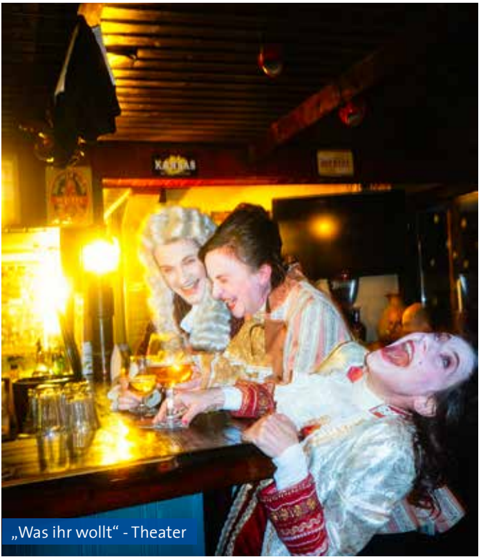
„Was ihr wollt“ - Theater