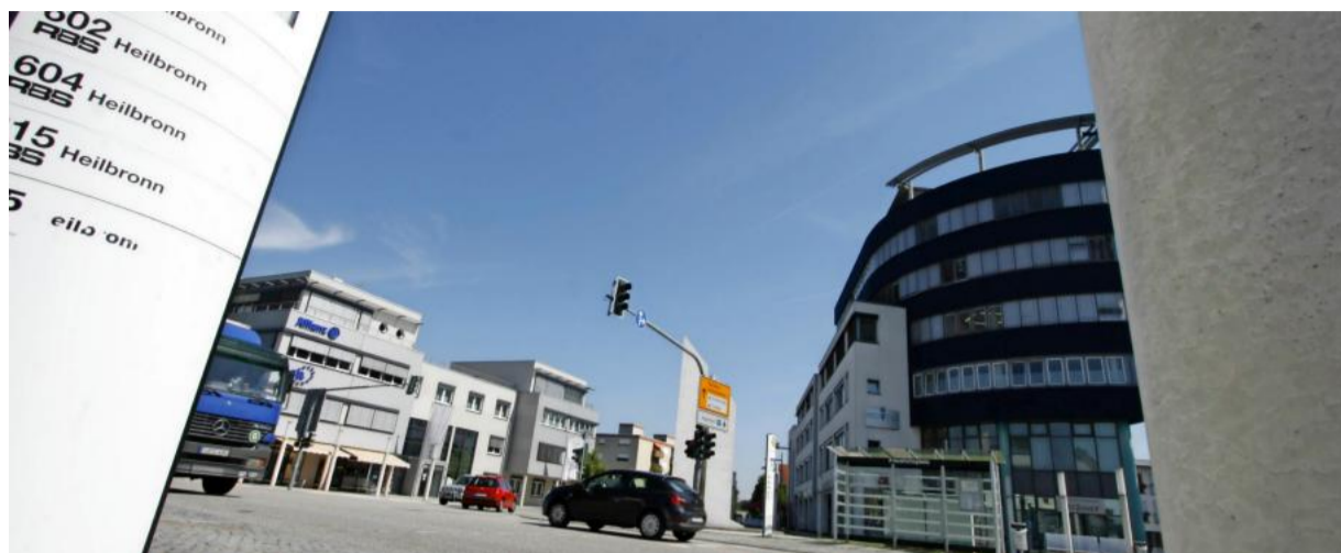
Wie ist es um den Einzelhandel in Bad Friedrichshall bestellt? Welche Bedingungen müssen herrschen, damit die künftige Entwicklung positiv verläuft? Das soll ein Gutachten klären.

Analyse Zunächst wird die aktuelle Einzelhandelsituation analysiert. Auf dieser Grundlage wird der künftige Entwicklungsbedarf in Bad Friedrichshall ermittelt und Vorschläge zur räumlichen Einzelhandelsentwicklung formuliert.